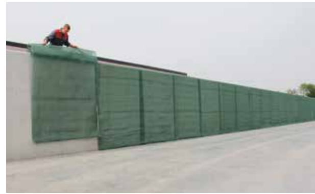
Krok 1: Tkané pásy jsou instalovány na stěnu žlabů s 25 cm překrytím po obou stranách silážního žlabu.