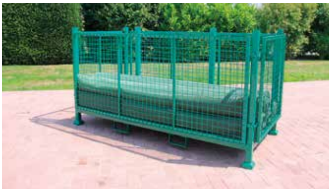
Kovový box pro skladování tkaných pásů.