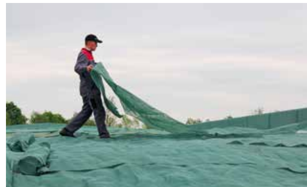
Krok 3: Po naskladnění a udusání siláže jsou silážní plachty přetáhnuty pře okraje do středu silážního žlabu.