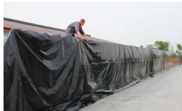
Krok 2: Silážní plachta se upraví na míru a přiloží na stěnu žlabu dle normálního postupu.