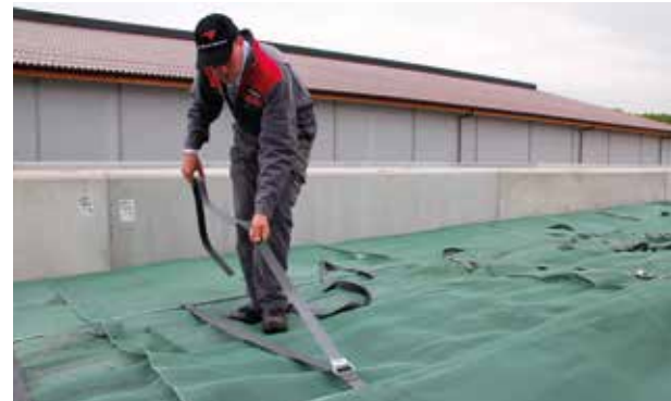
Krok 4: Tkané pásy jsou staženy z obou stran pomocí pásů se západkami. Stahování se provádí pomocí železných pák.